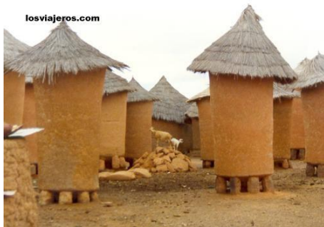
Cases circulars i graners