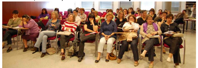
Els participants experimentant una proposta musical amb els ulls tancats